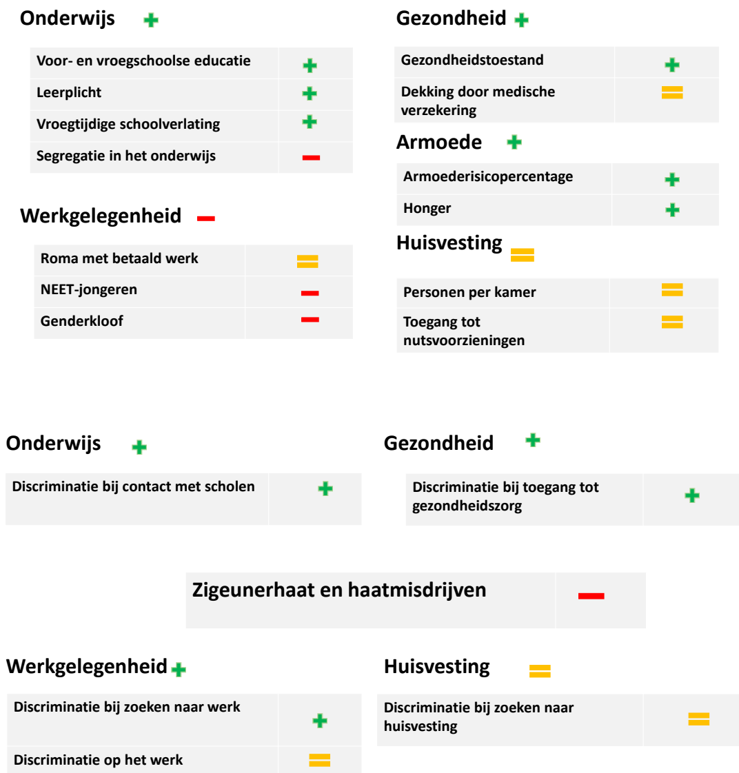
Grafiek 2: Veranderingen in de situatie van de Roma op de verschillende beleidsterreinen in de periode 2011-2016, armoede; discriminatie per gebied en zigeunerhaat