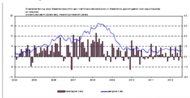
Figuur 1: verstrekking van kredieten aan het mkb 7

Ongeveer 98 % van de Nederlandse bouwbedrijven behoort tot het mkb. Deze bedrijven hebben eveneens te lijden onder het gebrek aan kredieten, en dat heeft faillissementen en ontslagen tot gevolg.