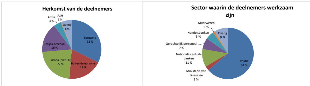
Grafiek I en II: herkomst van de deelnemers en sector waarin de deelnemers werkzaam zijn.

Uit de evaluatie van het programma "Pericles" in 2013 10 bleek verder dat ook de doelgroepen van het programma zeer relevant zijn. De belangrijkste doelgroep is de politie. Dit is tevens de doelgroep die het meest betrokken is bij de programma-activiteiten, als organisator en als deelnemer. Ook rechterlijke instanties en nationale centrale banken zijn uiterst relevant, en beide doelgroepen nemen aan de meeste programma-activiteiten deel, hoewel uit de evaluatie blijkt dat het wenselijk zou kunnen zijn om de rechterlijke instanties nog wat meer te betrekken. Ook de private sector, met name de financiële en bancaire sector, is een belangrijke doelgroep, met name in lidstaten die geen deel uitmaken van de eurozone en in derde landen waar opleidingen op nationaal niveau niet altijd door nationale autoriteiten worden verstrekt.