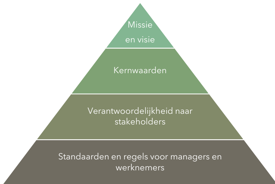
Figuur 1 Componenten van een business code

Bovenaan deze piramide vinden we de missie en visie van de arbeidsorganisatie 11 , gevolgd door de kernwaarden. Dan volgt de verantwoordelijkheid van de organisatie naar stakeholders, zoals leveranciers en klanten. De onderste laag uit de piramide vertegenwoordigt in feite de gedragscode: daarin is opgenomen welk gedrag er van iedereen in de organisatie verwacht wordt. Deze standaarden en regels voor leidinggevenden en werknemers vloeien voort uit de drie bovenste lagen van de piramide.