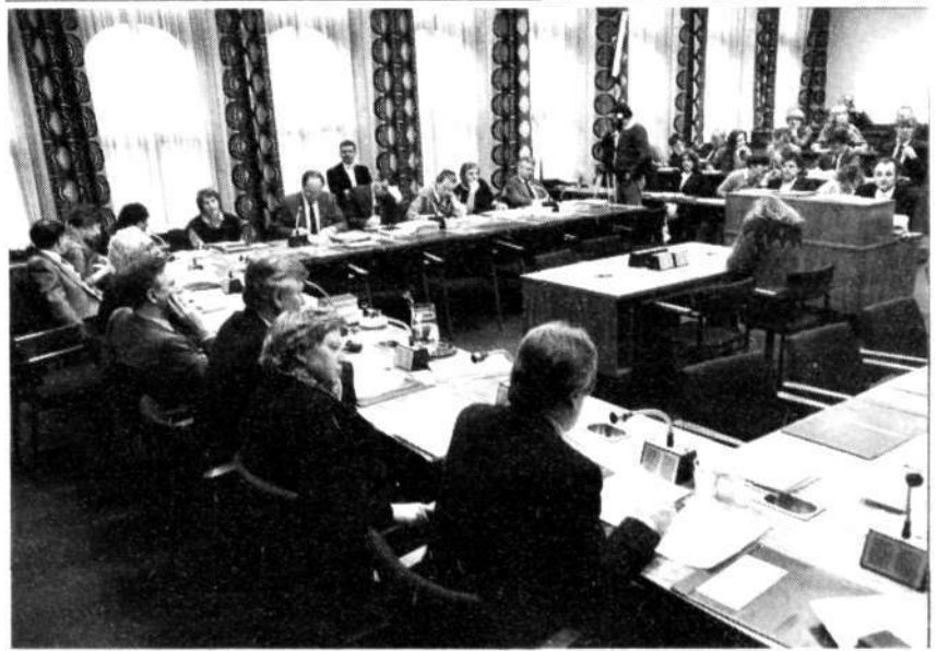
De vergadering wordt hervat in de Schepelzaal

Mijnheer de Voorzitter! Op het beleidsterrein dat aan mijn zorgen is toevertrouwd, staan in het komende