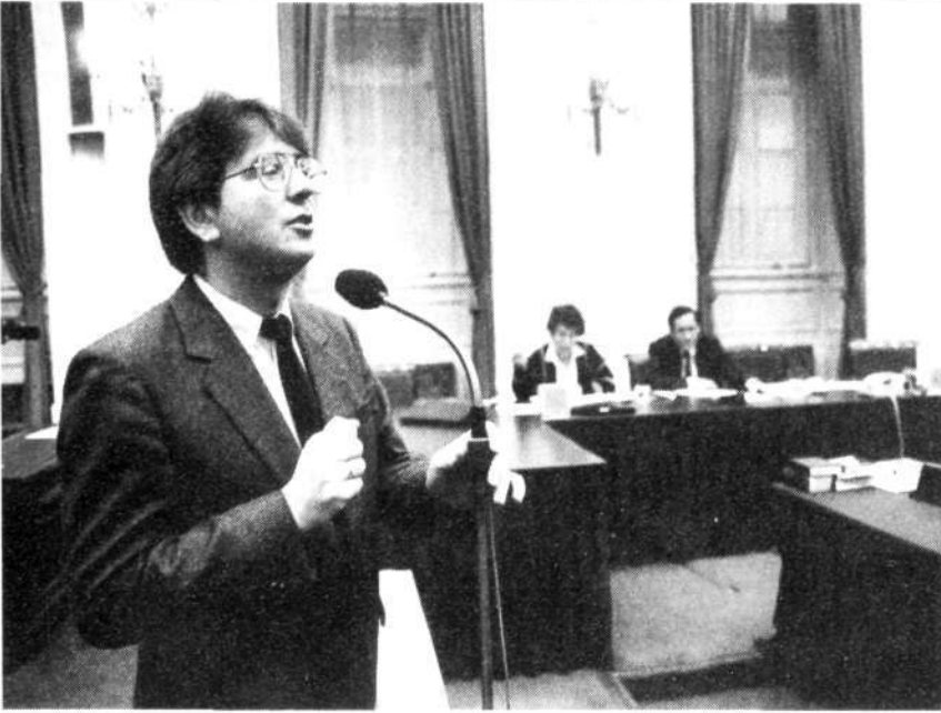
De heer Wallage (PvdA). Op de achtergrond staatssecretaris Ginjaar-Maas en minister Deetman van Onderwijs en Wetenschappen

een verliezer laat dicteren, hoeveel er bezuinigd moet worden. Tot op de dag van vandaag hebben wij nog geen enkele inhoudelijke verdediging door het CDA van de omvang van de bezuinigingen op het onderwijs vernomen. Wel weigerde het blad CD-Aktueel een advertentie van de katholieke onderwijsvakorganisatie tegen de bezuinigingen. De reactie van de KOV spreekt boekdelen: "De KOV ziet in de weigering een zoveelste aanwijzing dat de grootste regeringspartij onverschillig is voor het brede maatschappelijke protest dat zich in de onderwijswereld ontwikkelt."