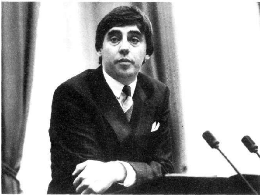
Minister Nijpels van Volkshuisvesting, Ruimtelijke Ordening en Milieubeheer

sten, waarbij met name de landen partij dienen te zijn, die op dit moment niet in de Europese Gemeenschap verenigd zijn. Dit betekent in feite een uitbreiding van de werkingssfeer van de post-Sevesorichtlijn naar de landen die geen lid zijn van de Gemeenschap.