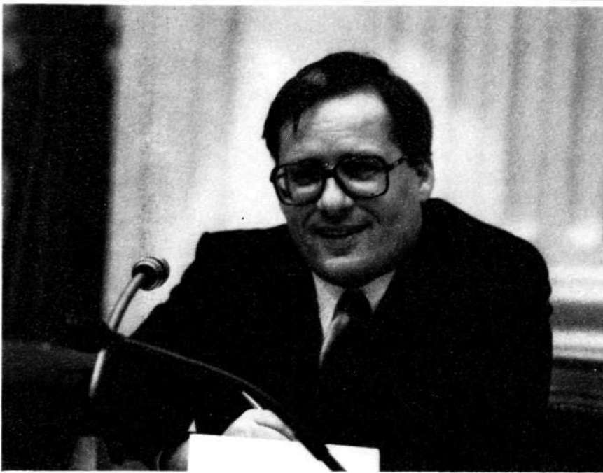
Minister Deetman van Onderwijs en Wetenschappen

complete invulling worden gekomen, met voorbijgaan aan de salarispost, dan zouden in ieder geval op jaarbasis 3500 arbeidsplaatsen moeten worden afgebroken boven het aantal van 5200.