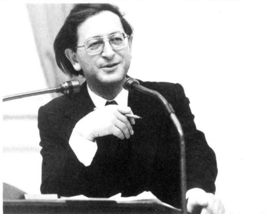
Minister Pais van Onderwijs en Wetenschappen

Minister Pais: Mijnheer de Voorzitter! In dit amendement wordt verwezen naar een financiering die ons tamelijk imaginair en illusoir voorkomt, omdat zij door de meerderheid der Kamer is afgewezen. Dat is ook de reden dat wij dit amendement afwijzen.