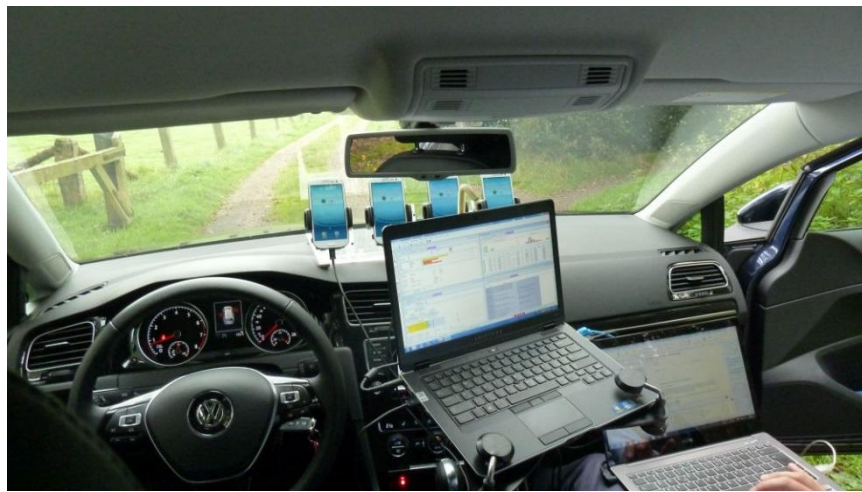
Afbeelding 3: Meetopstelling validatiemetingen

Voor de validatiemetingen (de drivetest) is gebruik gemaakt van een dienstwagen van Agentschap Telecom (personenauto, merk VW type Golf Variant). Op het dashboard zijn de vier telefoons gemonteerd die verbonden zijn met de meet- en testapparatuur waarmee elke 55 seconden een 1-1-2-oproep wordt gedaan. Speciale netwerkkapparatuur (ROMES TSMW) meet tegelijkertijd de eigenschappen van de verschillende netwerken in de ether, soort netwerk, signaalniveaus van de netwerken en eventuele netwerkkinterferentie en andere versturende factoren.