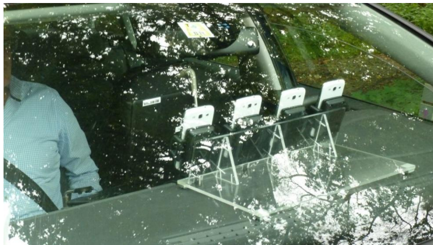
Afbeelding 4: Meetopstelling validatiemetingen