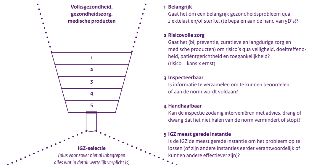
Afbeelding 3 IGZ-selectietrechter

In de IGZ-selectietrechter stoppen we de problemen, tekortkomingen en risico's die we zien. De filters 1 t/m 5 houden onderwerpen tegen of laten ze door [3] . De trechter levert ons een selectie aan te verminderen risico's op gezondheidsschade. Dat zijn er altijd meer dan we aan kunnen, dus moeten we prioriteren. We kiezen voor prioritaire aanpak van risico's die het schadelijkst zijn voor de gezondheid en die het snelst met betere naleving door ondertoezichtstaanden zijn te reduceren. We kijken welke mensen en middelen we kunnen inzetten (linkervak in IGZ-cirkel in afbeelding 2), plannen onze werkzaamheden (middelste vak in IGZ-cirkel in afbeelding 2) en leveren producten op waarmee we de naleving bevorderen (rechtvak in IGZ-cirkel in afbeelding 2). Soms moeten we via advies aan bewindslieden of aan zorgkoepels onze invloed vergroten. We gebruiken onze