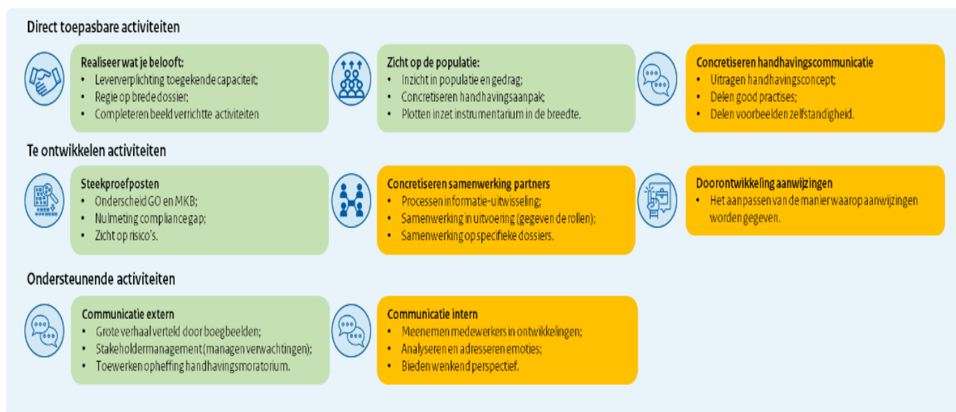
Figuur 1: overzicht activiteiten versterken en verbeteren handhaving naar categorie